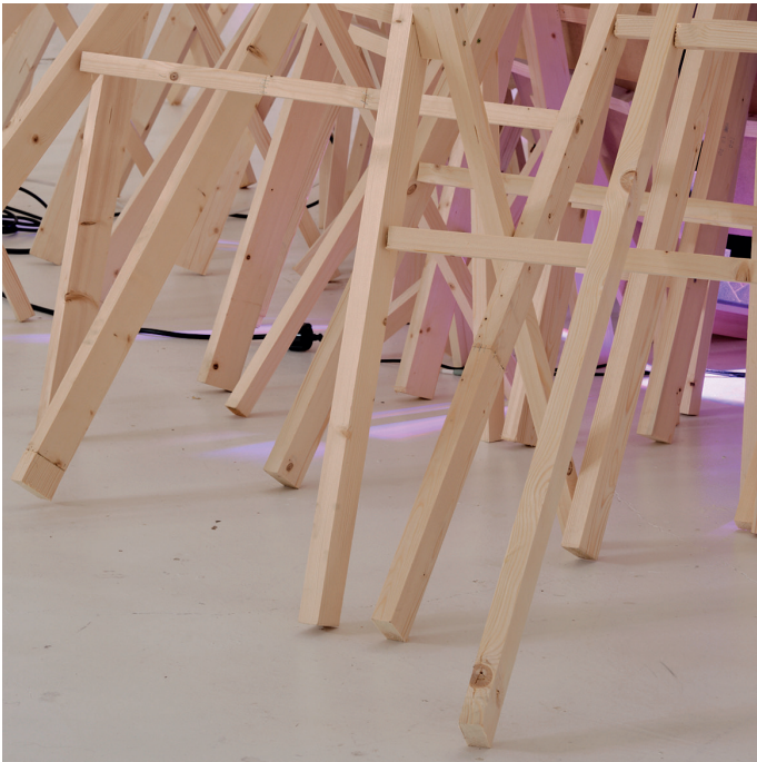
TAKK (fragment) 2022