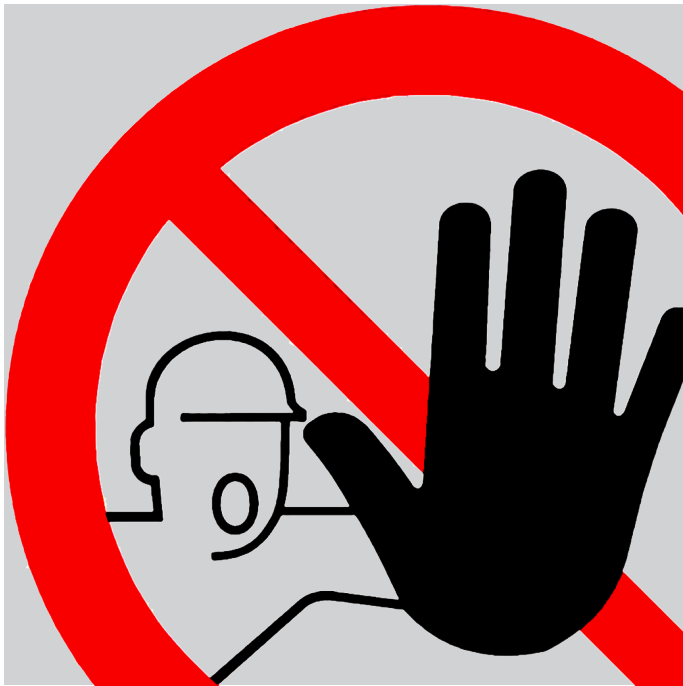
RECETAS URBANAS (SANTI CIRUGEDA + ALICE ATTOUT) (fragment) 2022