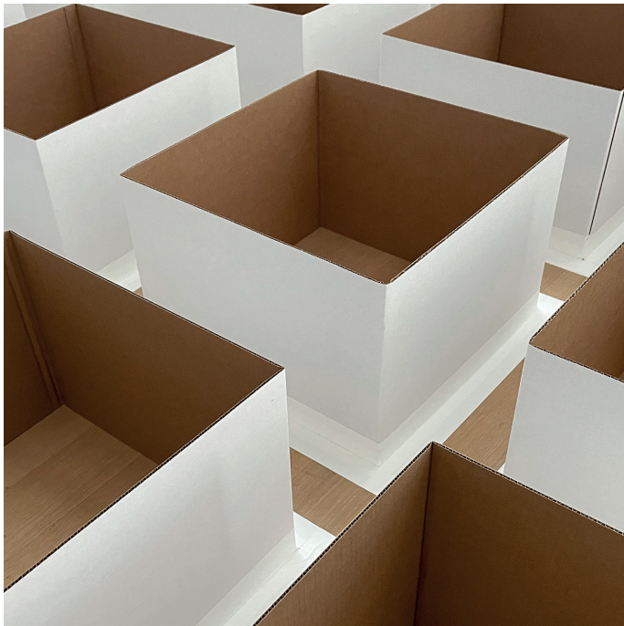
CARLOS BUNGA (fragment) 2015—22