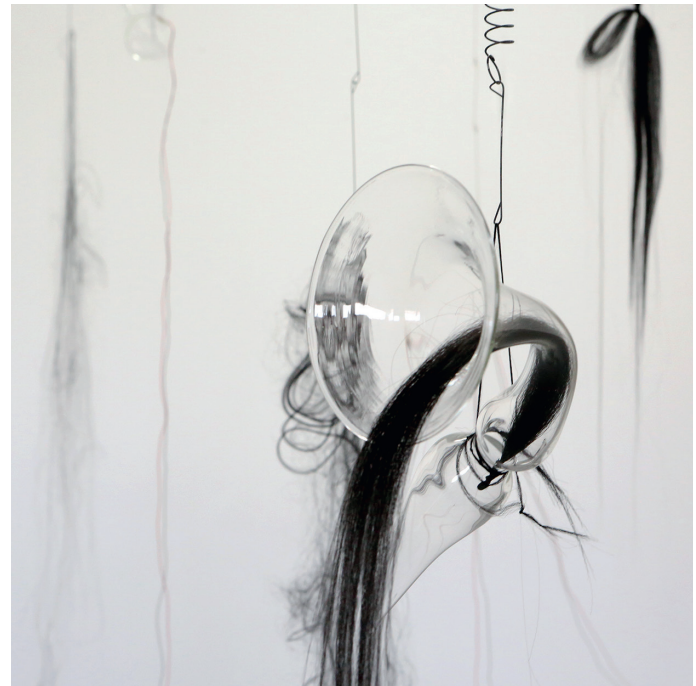
STELLA RAHOLA (fragment) 2020–22