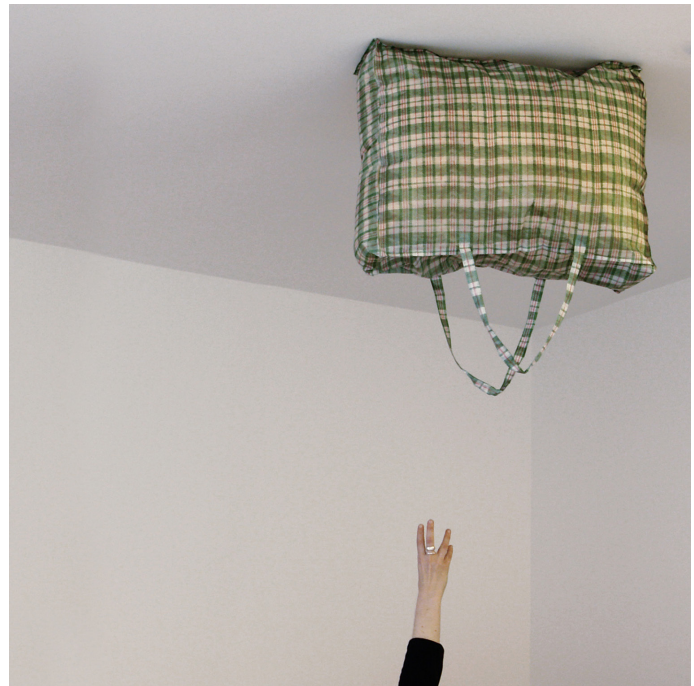
BLANCA CASAS (fragment) 2009—22