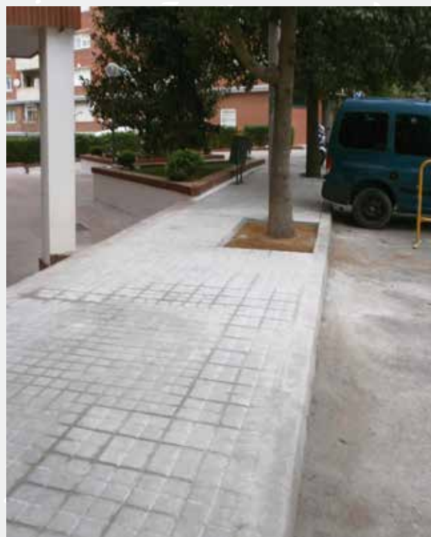
Actuació realitzada a l'av. de la Generalitat de Catalunya, 3. Arranjament de vorera i escocell