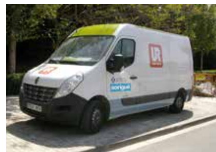
Vehicles que utilitza el servei