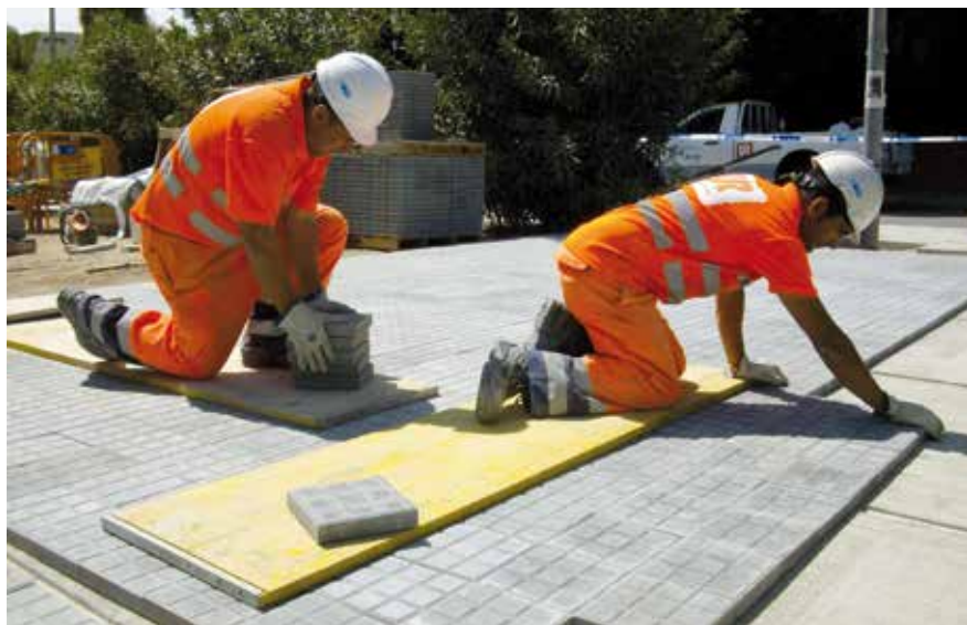
La Unitat Ràpida arranjan la vorera del passeig de Can Sagrera.

Al llarg dels tres anys que fa que es va posar en marxa el servei, ha dut a terme més de 1.500 actuacions: ha arranjat 4.437m 2 de vorera, i ha asfaltat 3.123 m 2 , entre d'altres actuacions. Amb aquestes xifres, l'empresa ACSA Obras e Infraestructuras, S.A, del grup Soriguú, vetlla per donar una atenció de qualitat a la ciutadania amb plena coordinació amb els serveis municipals.