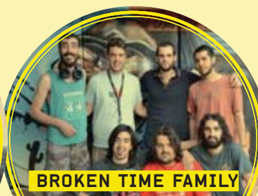
BROKEN TIME FAMILY