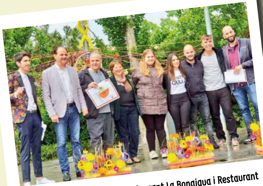
Felicitats a Cuina Miracle, Restaurant La Bonaigua i Restaurant L'Illa per les tapes guanyadores del QuintoTapa 2018.