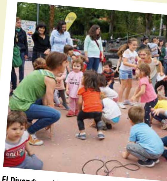
El Divendres al Parc ple d'activitats i famílies al Parc de Joan Maragall.