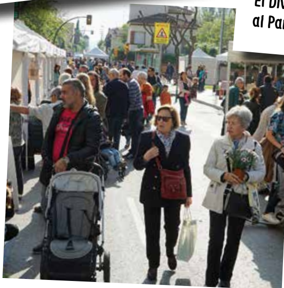
La Festa del Comerç amb la participació de comerços i associacions.