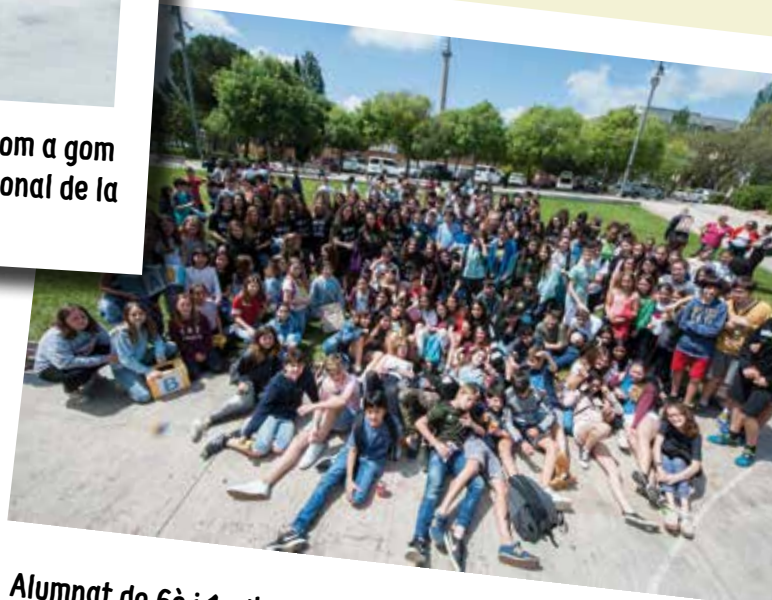
Alumnat de 6è i 1r d'ESO de les escoles participants a l'11a edició d'English Day.