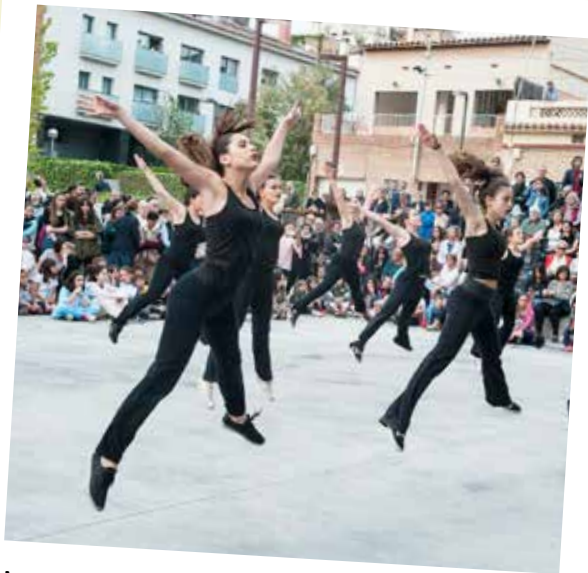
Les escoles de dansa van omplir de gom a gom la pl. Malaret durant el Dia Internacional de la Dansa.