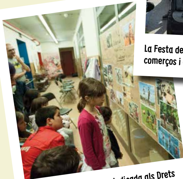
La Festa de la Pau 2018 dedicada als Drets dels Infants.