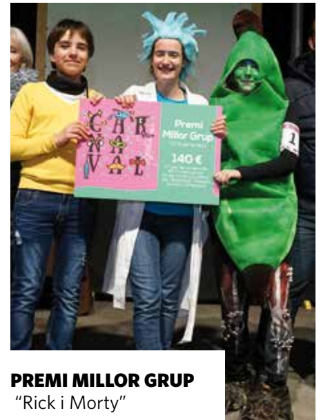
PREMI MILLOR GRUP "Rick i Morty"