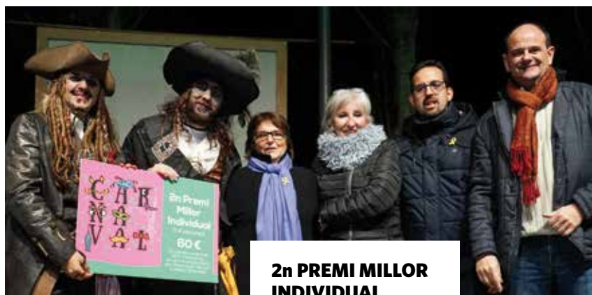
2n PREMI MILLOR INDIVIDUAL "Pirates del Carib"