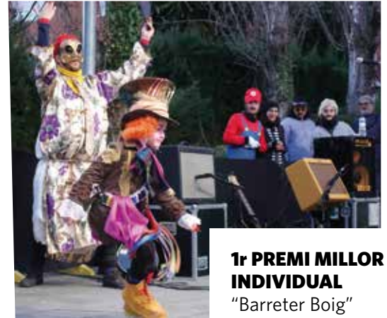
1r PREMI MILLOR INDIVIDUAL "Barreter Boig"