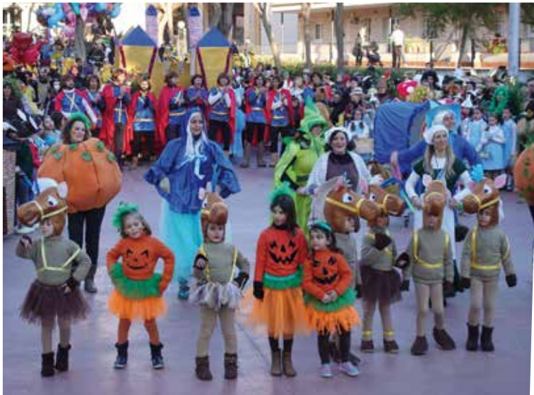
2n PREMI MILLOR COMPARSA ESCOLAR "Un Montseny de conte" de l'AMPA Escola Montseny