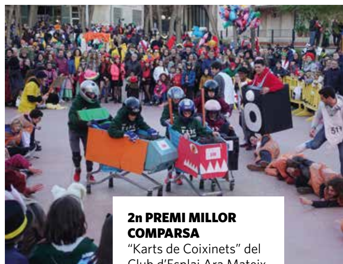
2n PREMI MILLOR COMPARSA "Karts de Coixinets" del Club d'Esplai Ara Mateix

Vegeu el vídeo del Carnaval 2018 al canal youtube de l'Ajuntament