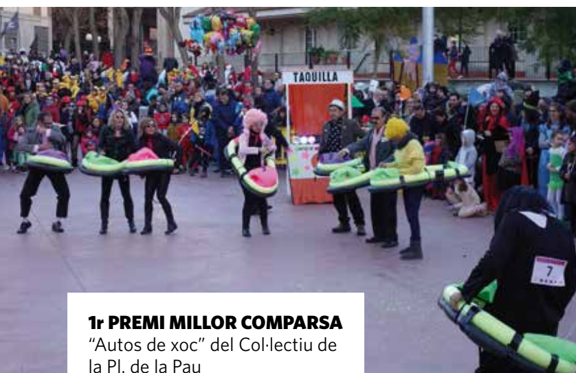
1r PREMI MILLOR COMPARSA "Autos de xoc" del Col·lectiu de la Pl. de la Pau