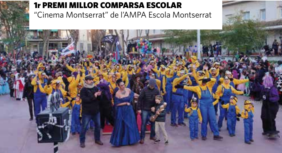
1r PREMI MILLOR COMPARSA ESCOLAR "Cinema Montserrat" de l'AMPA Escola Montserrat