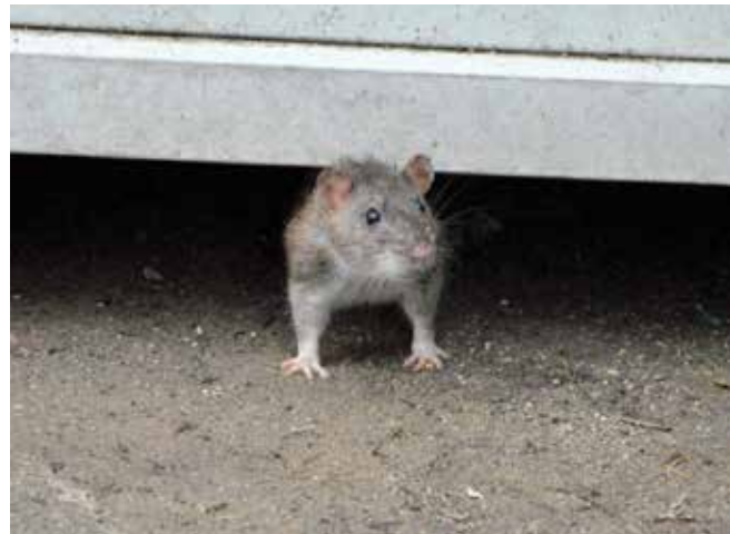
Rata de claveguera ( Rattus norvegicus )

Es fan tractaments durant tot l'any en els punts conflictius. S'actua per mitjà d'esquers rodenticides que venen servits en blocs parafinats que es penjen amb uns filferros en els pous de clavegueram i embornals.