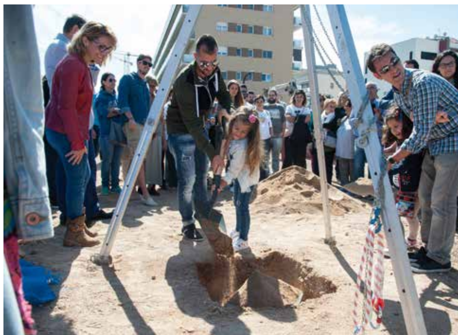
Les persones adjudicatàries van participar en l'acte de la 1a pedra