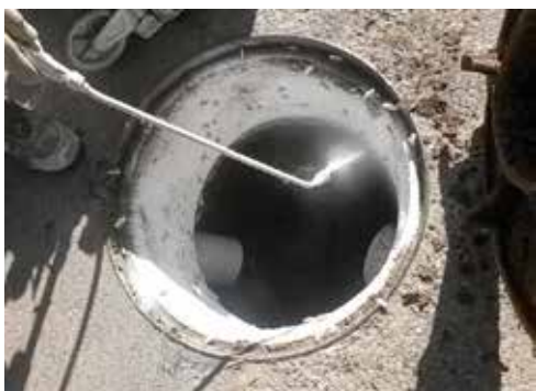
Tractament de clavegueram amb pintura insecticida per a paneroles