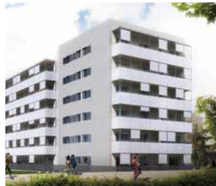
Imatge virtual de la promoció d'habitatge públic del c. Violeta Parra, 8-12

i traster. Una aposta més de Promunsa i l'Ajuntament que vetlla per continuar amb el compromís de facilitar l'accés a l'habitatge. 🏡