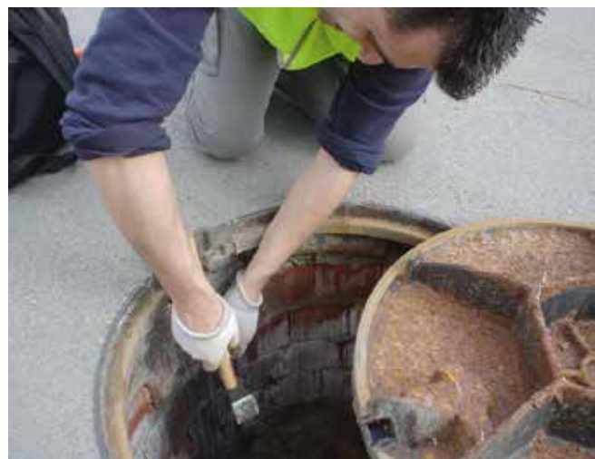
Col·locació d'enceball per a rosegadors