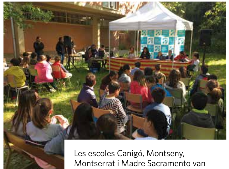
Les escoles Canigó, Montseny, Montserrat i Madre Sacramento van participar, un any més, al programa Justa la fusta de Ràdio Desvern especial Sant Jordi, que es va emetre des de l'Institut de Sant Just amb la col·laboració d'alumnat de 4t d'ESO.