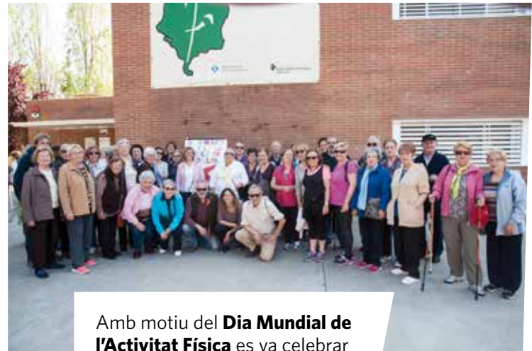
Amb motiu del Dia Mundial de l'Activitat Física es va celebrar la VII Caminada i II Marxa Nòrdica organitzada per l'Àrea Bàsica de Salut i l'Ajuntament.