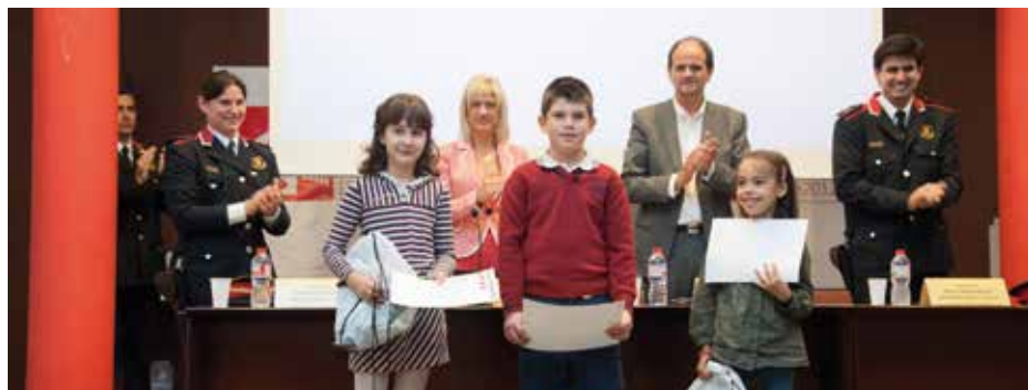
Acte de commemoració de l'aniversari amb la presència dels alcaldes dels dos municipis i la cap de la comissaria