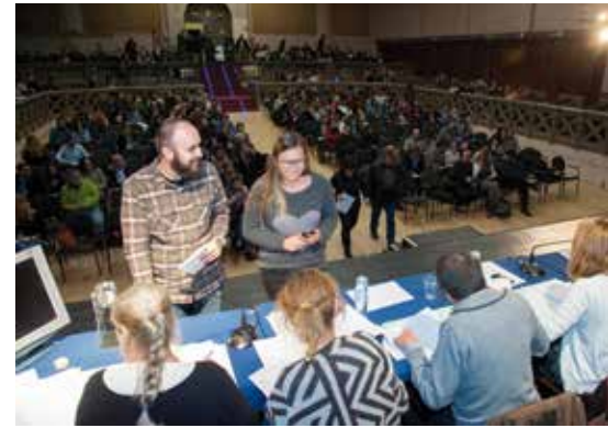
A la imatge, sorteig dels 54 habitatges públics de Mas Lluí que es va fer davant notària

supramunicipals per promocionar l'habitatge públic, l'Ajuntament té el compromís de seguir treballant en aquesta línia, com ha fet en els darrers anys.❖