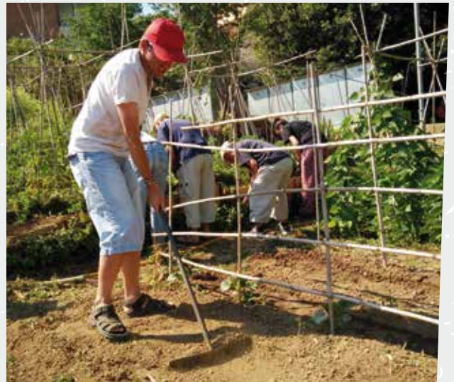
Grup d'alumnat d'Asproseat a l'hort que té adjudicat el Centre Pilot