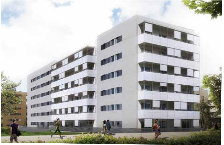
Imatge virtual dels habitatges públics que es faran a Mas Lluí

Les persones interessades en la nova promoció pública que Promunsa construirà a Mas Lluí poden presentar la sol·licitud del 5 de setembre al 7 d'octubre. Es faran 36 habitatges de protecció oficial de règim general de venda al c. Violeta Parra 8-10. Tindran entre 55 i 90m 2 de 2, 3 o 4 habitacions. El preu màxim de venda del metre quadrat útil serà de 1.875 € (de 130.000 a 200.000 € en funció de la superfície útil de cada habitatge, IVA inclòs). Els preus també inclouen plaça d'aparcament i traster. Les bases es poden consultar al web de Promunsa.