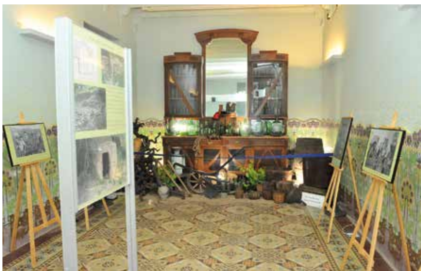
Exposició realitzada del passat vitivinícola de Sant Just al CIM

Centre d'Interpretació del Municipi (CIM). L'Arxiu i els col·lectius que volen difondre la seva història fan servir aquest espai (a la planta baixa de Can Ginestar) adequat per fer-hi exposicions.