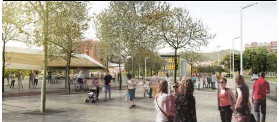
Imatge virtual de Sant Just Desvern des de l'altre costat de la B23, amb l'edifici Walden7 al fons a l'esquerra i Les Basses de Sant Pere a la dreta

on es troba el Centre de Negocis Santjust-Diagonal i l'Hospital Comarcal Moisès Broggi.