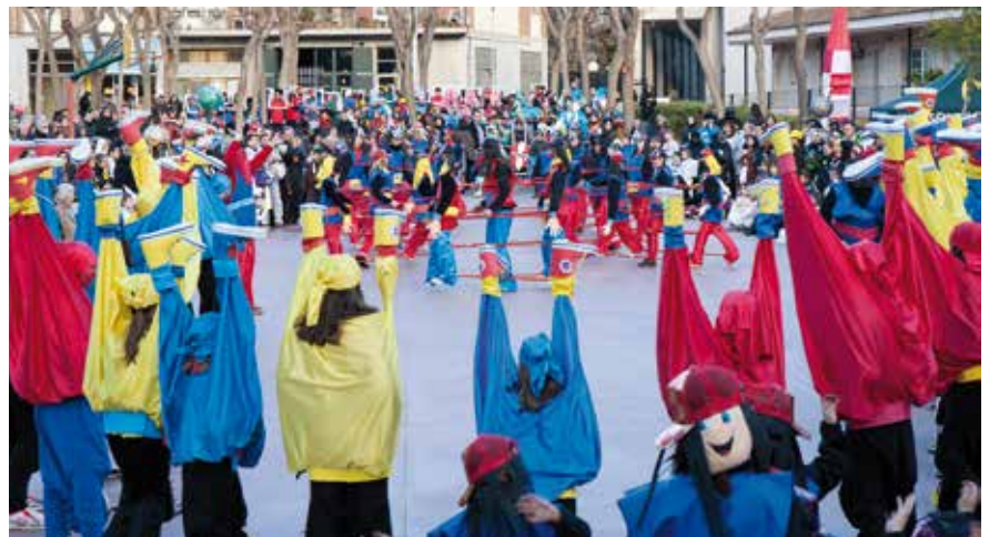
Millor comparsa (600 €): "Fixa-t'hi bé", formada per 50 persones