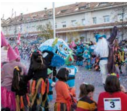
Un moment de la rua