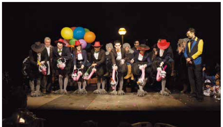
Millor grup -de 2 a 9 persones- (300 €): "La doma de l'estruç"