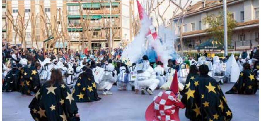
Millor comparsa escolar (700 €): "El Montseny se'n va a l'espai", de l'escola pública Montseny

La cloenda de la festa va ser a la pl. de Camoapa, amb xocolatada, la crema del Rei Carnestoltes i música. ■■